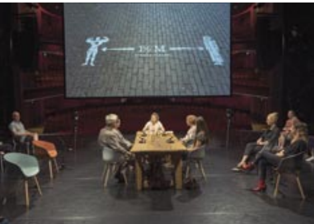
Salon Hiphop & Romanticism Now!