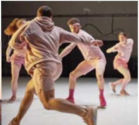
Space Frantics Dance Company