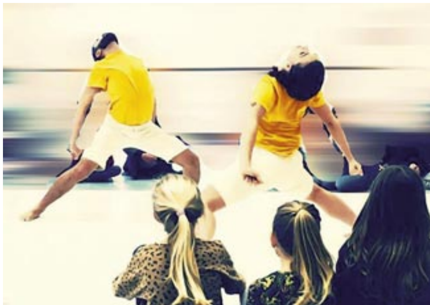
Dit Dat Dans

„Dit Dat Dans“ vereint Vorstellung mit Workshop und wendet sich speziell an ein junges Publikum sowie Verwandte. Diese Vorstellung präsentiert eine einzigartige Möglichkeit, Tanz gemeinsam und mit allen Fasern des Körpers zu erleben. Mit der Nase auf der Tanzfläche werden junge Menschen