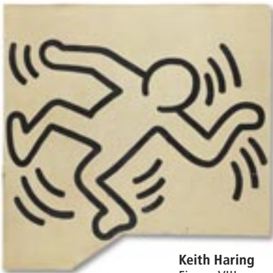
Keith Haring Figure VIII