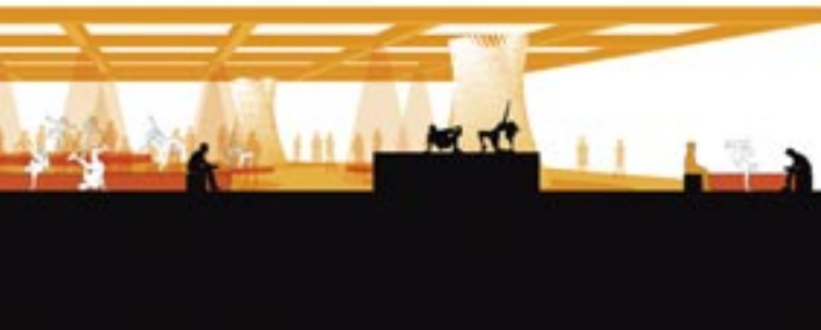
Ballet Mécanique 2.0 Tanzperformance