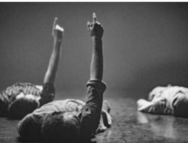
Hofesh Shechter Company

De videoportretten en nagesprekken vormen samen een inhoudelijke omlijsting van de dansvoorstelling. Daags na de voorstelling plaatsen wij ze als minidocumentaire online op onze website, zodat liefhebbers – waar dan ook ter wereld – ze kunnen bekijken. Samen vormen de docu's een levend en alsmaar groeiend archief van schrit_tmacher door de jaren heen.