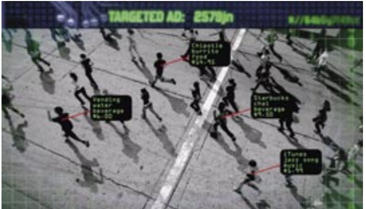
Targeted Advertising SIDEWALK Movies 2.0